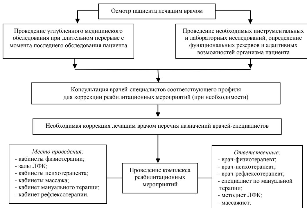
Рис. 1. Алгоритм проведения реабилитационных мероприятий в отделениях стационара

6. Оценка специалистами результатов реабилитационных мероприятий.