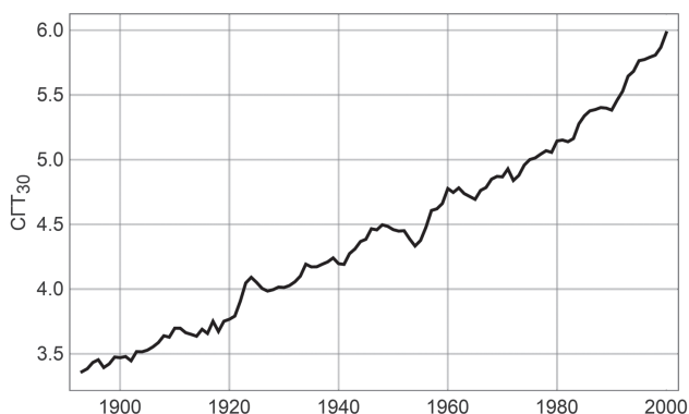
Рис. 2. Изменения среднегодовой температуры воздуха в Москве в XX в.

од снижения САК_{30} (рис. 3, сплошная линия), из чего можно предположить, что снижение ИКГ_{30} , связанное с повышением СГТ_{30} , сдерживалось в середине века из-за снижения САК_{30} , а в конце века, наоборот, усиливалось из-за повышения САК_{30} — другими словами, что отклонения ИКГ_{30} от средней величины за период 1879–2015 гг., ИКГ_{cp} , можно представить в виде линейной комбинации отклонений СГТ_{30} и САК_{30} :