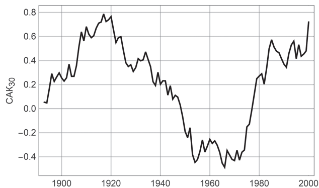
Рис. 1. Изменения годового индекса североатлантического колебания (САК) в XX в.