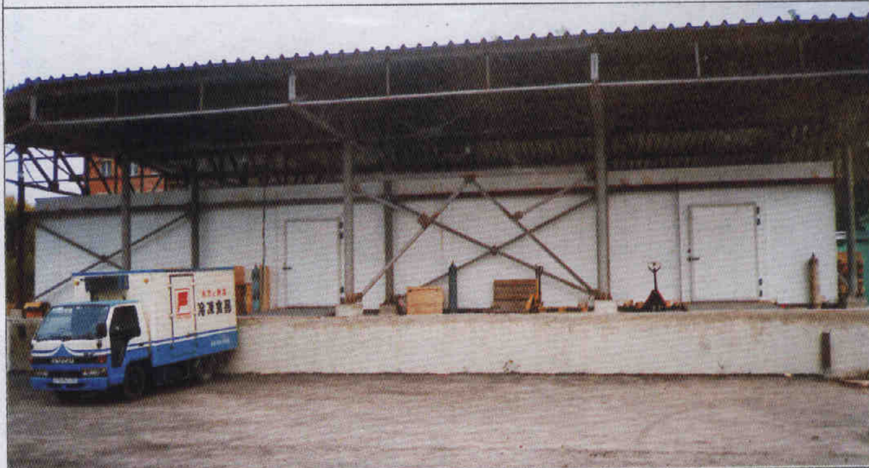
Низкотемпературный склад хранения готовой продукции объемом 1100 м 3 на фабрике мороженого «Инфрост» (Омск)

ства различной конструкции – распашные, откатные, подъемные.