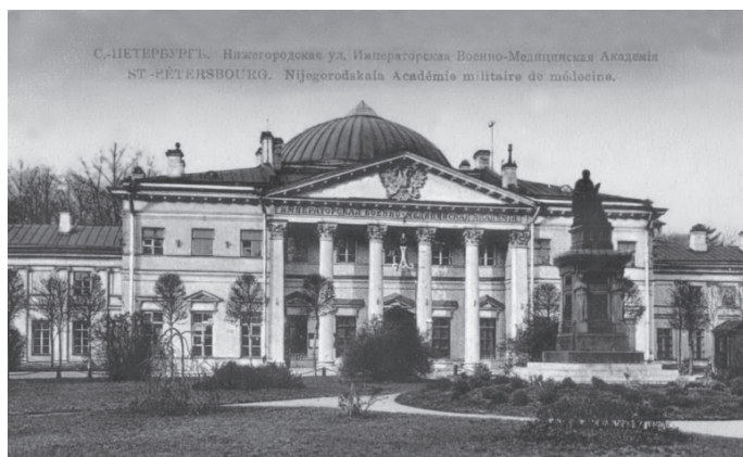
Рис. 1. Главное здание Императорской Военно-медицинской академии. С почтовой открытки начала XX в.

Гарвардский университет (г. Кембридж, штат Массачусетс) — один из наиболее известных университетов США и всего мира. Как и в большинстве элитных учебных учреждений наибольшей популярностью среди его студентов пользуется медицина. В настоящее время в нем функционируют медицинская школа, институт богословия (в ВМА кафедра богословия ликвидирована в 1918 г.), институт общественного здравоохранения, школа стоматологии, музей естественной истории (в академии кафедра истории медицины ликвидирована в 1955 г.), собственный бота-