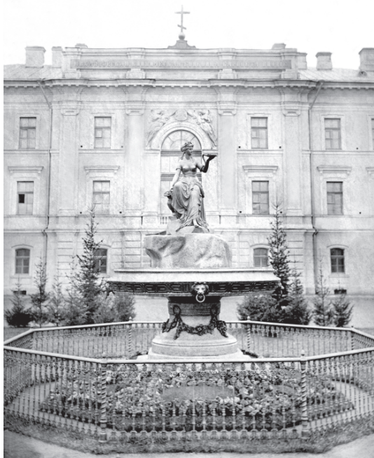
Рис. 5. Михайловская клиническая больница баронета Виллие и фонтан «Гигиеня» (скульптор Д.И.Иенсен)

Последние архивные документы, свидетельствующие о жизнедеятельности