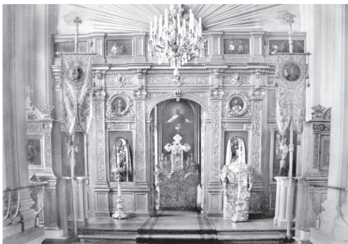
Рис. 6. Иконостас и алтарь храма Михайловской клинической больницы