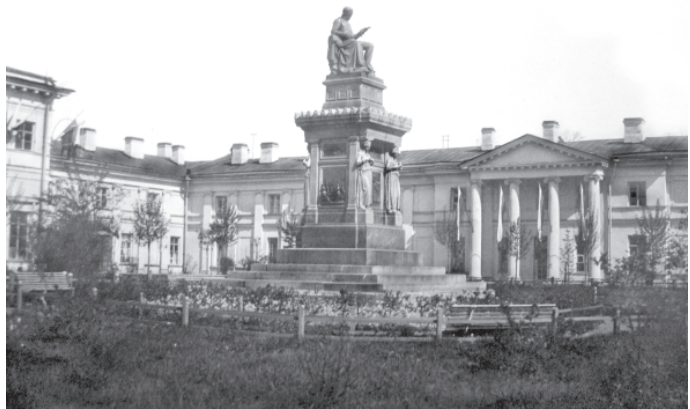
Рис. 2. Памятник первому президенту академии Я.В.Виллие перед ее главным зданием. Освящен в 1859 г.

В постсоветскую эпоху, несмотря на статус наследия федерального уровня, памятник сильно пострадал: были утраче-