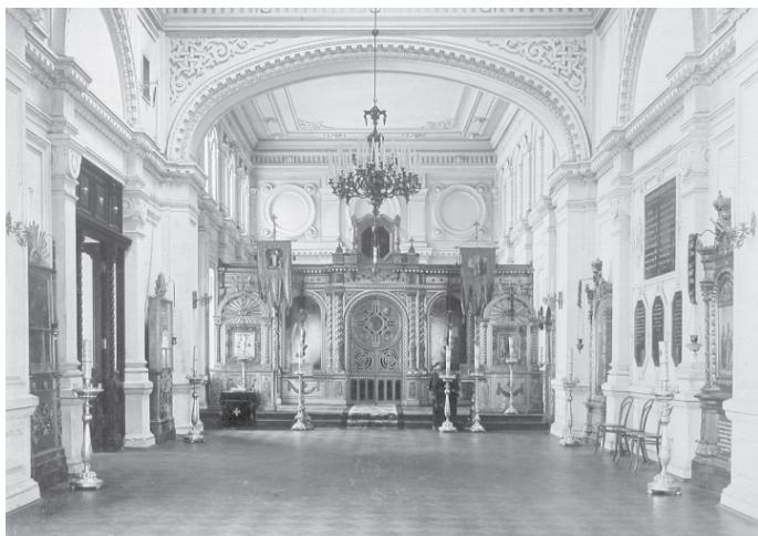
Рис. 3. Внутреннее убранство главного академического храма в честь иконы Смоленской Божией Матери

Второе освящение храма было осуществлено 19 октября 1896 г. митрополитом Палладием. Весной 1909 г., ввиду предстоящего празднования 100-летия освящения храма, в нем были выполнены большие реставрационные работы: золочение и исправление деревянных