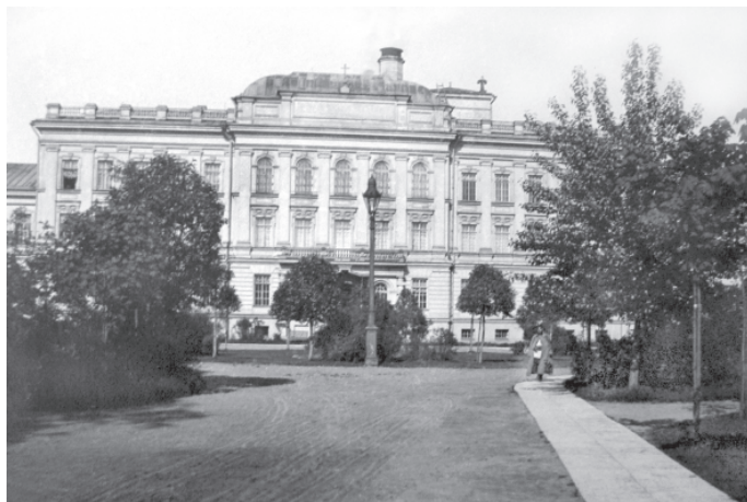
Рис. 7. Главное здание клиники душевных и нервных болезней

Строительство обошлось в 900 тыс. руб., отпущенных из Военного министерства, благодаря особому попечению военного министра и почетного президента ИВМА П.С.Ванновского. Здание клиники строилось 5 лет, она была открыта (освящена) в июне 1892 г. По всеобщему признанию современников, клиника считалась одной из лучших в Европе (рис. 7).