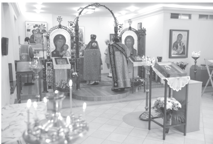
Рис. 8. Возрожденный храм в честь иконы Божией Матери «Утоли моя печали» при клинике психиатрии академии

«Всем тем, чего мы не имеем, мы обязаны только себе», – эти слова профессора