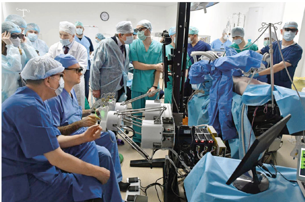
Фото 1. Демонстрация работы российского робот-ассистирующего хирургического комплекса, г. Пенза, март 2018 г.

ком предстательной железы. Следует отметить, что до настоящего времени не проводилось мультицентровых рандомизированных исследований, которые позволили бы сравнить результаты робот-ассистированных операций и радикальной позадилоной простатэктомии. В ряде обсервационных и когортных исследований отмечены лучшие или сопоставимые онкологические результаты и функциональные исходы робот-ассистированной радикальной простатэктомии по сравнению с "открытой" радикальной позадилоной простатэктомией. Вместе с тем известно, что лучшие результаты лечения рака предстательной железы определяются в значительной степени опытом оперирующего врача и опытом клинического центра, где проводится лечение.