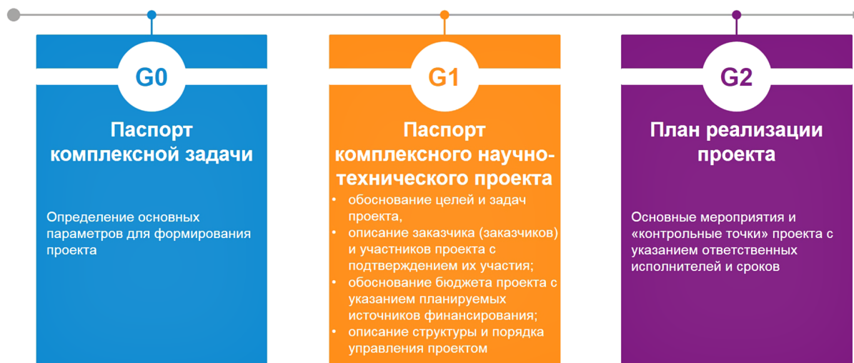
Рис. 3. Гейты в формировании комплексной научно-технической программы полного инновационного цикла "Связанность территории РФ"

Все проекты, предложенные для включения в Программу, должны пройти экспертизу по критерию наличия реалистичных, обоснованных и потенциально решаемых в ближайшие 3–15 лет научно-технических задач, научно-технического задела и предполагаемых исполнителей проекта, а также заказчика и промышленных партнёров. Применение "гейтового подхода" при формировании Программы (рис. 3) реализует заложенный в Стратегии научно-технологического развития принцип полного инновационного цикла, позволяющий выявлять и устранять разрывы в инновационных цепочках, доводя результаты исследований и разработок до стадии практического применения и удовлетворяя спрос хозяйствующих субъектов на инновационные научно-технические решения.