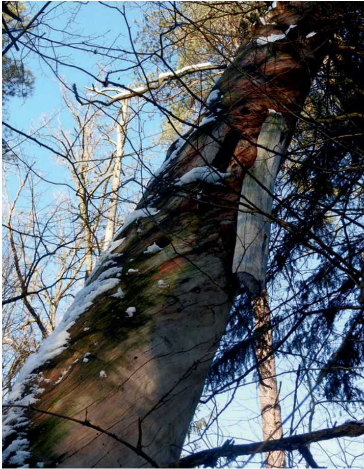
Рис. 1. Сосна с бортью в Беловежской пуще (Польша). Сохранилась деревянная планка, защищавшая леток.