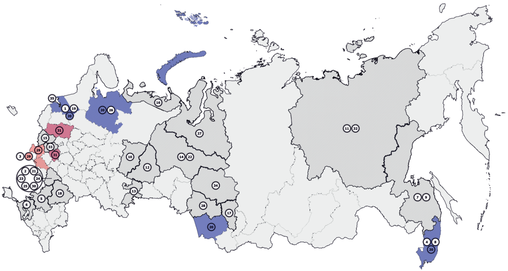
Рис. 3. Территориальное поведение поставщиков регионального сегмента рынка ТСК.