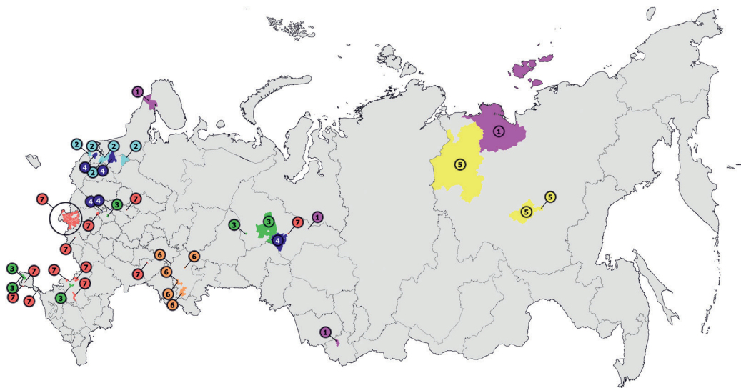
Рис. 2. Территориальное поведение поставщиков муниципального сегмента рынка ТСК. 1 — ООО «Научные разработки», 2 — ООО «РЕГИОН-ЭКСПО», 3 — ООО «Экспертная организация „Развитие и осторожность“», 4 — ФГАОУ ВО «НИУ „ВШЭ“», 5 — ФГАОУ ВО «Северо-Восточный федеральный университет им. М. К. Аммосова», 6 — ФГБНУ УФИЦ РАН, 7 — ФГБОУ ВО «РАНХиГС при президенте РФ».