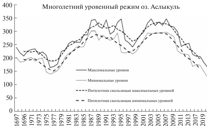
Рис. 1. Многолетняя изменчивость уровней воды в оз. Асылыкуль.