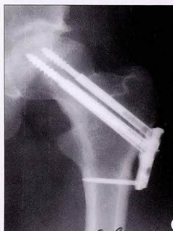
Рис. 4. Рентгенограммы пациента с переломом ШБК типа Garden 2 с «отстоянием» пластины от диафиза бедренной кости.