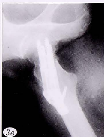
Рис. 3. Рентгенограммы пациентки Н. при поступлении (а), в 1-е сутки (б) и через 3 мес (в) после операции.