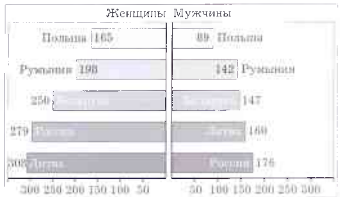
Рис. 3. Региональные стандартизированные показатели первичной заболеваемости (на 100 000 населения) переломом ПОВК у лиц в возрасте 50 лет и старше в Республике Беларусь и некоторых соседних странах.

Заключение. В рамках многоцентрового исследования ЭВА в Республике Беларусь проведено