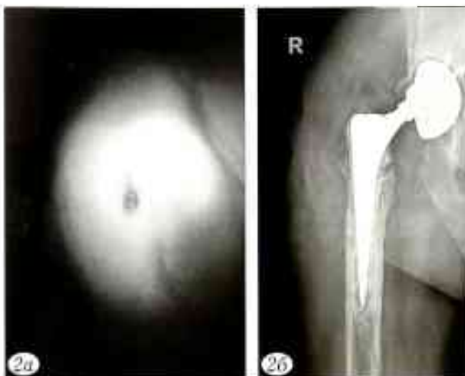
Рис. 2. Вид свищевых ходов (а) и рентгенограмма (б) после госпитализации в отделение гнойной хирургии РНИИТО им. Р.Р. Вредена. Выявлена септическая нестабильность эндопротеза, хронический остеомиелит бедра и костей вертлужной впадины: частичная деструкция большого вертела, остеолиз, многочисленные участки локального и линейного остеолитического поражения кортикального слоя, миграция вертлужного компонента эндопротеза.

тканевых биоптатах: штамм MRSA и штамм Bilophila wadsworthia в диагностически значимых титрах. С учетом нормальной функции почек (креатинин крови 57 мкмоль/л) и избыточной массы тела пациента (110 кг при росте 178 см) доза ванкомицина была увеличена до максимально возможной — по 2 г 2 раза в сутки и ципрофлоксацин заменен на цефоперазон/сульбактам (4 г 2 раза в сутки), обладающий активностью в отношении анаэробных возбудителей. Однако выполненный на 3-и сутки после коррекции антибактериальной терапии (10-е сутки после операции) мониторинг остаточной концентрации ванкомицина в крови показал крайне низкий уровень — 2,1 мкг/мл при целевых значениях 15–20 мкг/мл. К этому моменту у пациента были отмечены клинико-лабораторные признаки рецидива инфекционного процесса: серозно-геморрагическое отделяемое из раны, нарастание уровня С-реактивного белка. Принято решение о ревизионной операции с радикальной хирургической обработкой и переустановкой спейсера, которая была выполнена через 12 сут после первой санации (рис. 3, б). Импрегнацию нового спейсера проводили фосфомицином из расчета 4 г на 40 г цемента. Со дня операции пациент продолжал получать цефоперазон/сульбактам в прежней дозировке, ванкомицин в связи с низкой