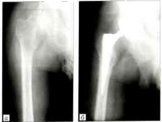
Рис. 1. Рентгенограммы правого тазобедренного сустава до (а) и после (б) операции.

В июне 2016 г. выполнен I этап двухэтапного ревизионного эндопротезирования: радикальная хирургическая обработка, удаление эндопротеза, имплантация статического антибактериального (ванкомицин, гентамицин) спейсера правого тазобедренного сустава (рис. 3, а). Была назначена парентеральная комбинированная антибактериальная терапия в стандартных дозах: ванкомицин 1 г 2 раза в сутки и ципрофлоксацин 0,6 г 2 раза в сутки. На 8-е сутки после операции получены результаты бактериологического исследования удаленных компонентов эндопротеза и