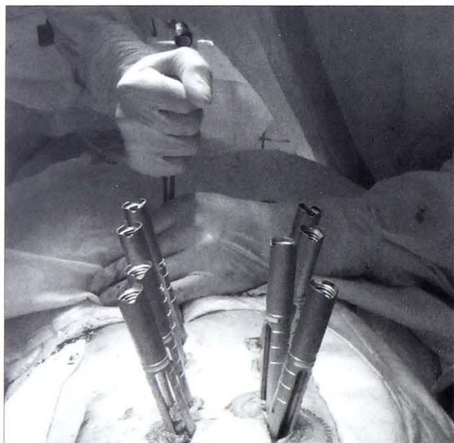
Рис. 1. Интраоперационное фото. Чрескожное проведение продольной балки через направляющие порты.

Ретроспективно проанализированы проспективно собранные данные о 25 пациентах с травматическими компрессионными переломами грудного