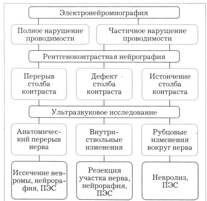
Рис. 2. Алгоритм интраоперационной диагностики и тактики хирургического лечения при повреждениях периферических нервов.

Если при интраоперационном ЭНМГ-тестировании констатировали полное нарушение проводимости нерва, при ультразвуковом сканировании определяли эхопризнаки перерыва его ствола с центральной невромой, а на нейрограмме выявляли дефект столба контраста, то ставили показания к иссечению невром, нейрографии с установкой на