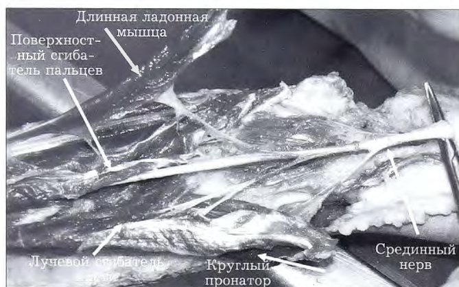
Рис. 1. Препарированный срединный нерв и его мышечные ветви (мужской труп, левое предплечье).

Срединный нерв визуализировали лежащим на плечевой мышце, сразу медиальнее двуглавой мышцы плеча (рис. 1). Затем постепенно препарировали все мышцы, через которые проходил срединный нерв и его ветви до карпального канала. Идентифицировали передний межкостный нерв,