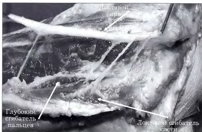
Рис. 2. Препарированный локтевой нерв и его мышечные ветви (мужской труп, левое предплечье).

отходящий от срединного нерва в проксимальном отделе предплечья. Топографическую анатомию переднего межкостного нерва и его ветвей не изучали, так как она описана в большом анатомическом исследовании T. Essa и соавт. [13].