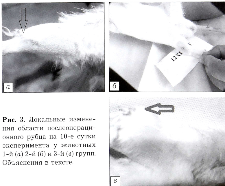
Рис. 3. Локальные изменения области послеоперационного рубца на 10-е сутки эксперимента у животных 1-й (а) 2-й (б) и 3-й (в) групп. Объяснения в тексте.