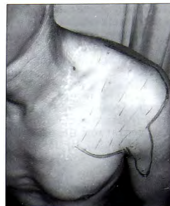
Рис. 3. Больной Б., 28 лет. Определяется обширная зона анестезии кнаружи от рубца (отмечена фломастером). Испытывает постоянные боли и неприятные ощущения в области рубца. Прикосновение к верхней части рубца вызывает резкую боль по типу «удара током».

3. Данное осложнение может возникнуть при выполнении как горизонтального, так и вертикального хирургического доступа.