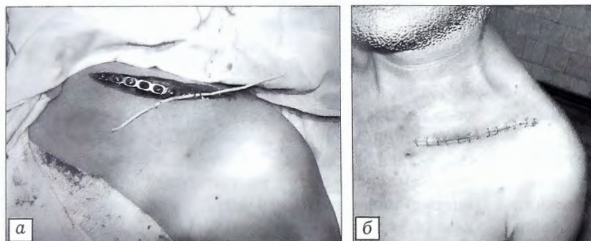
Рис. 2. Больной О. 33 лет с переломом ключицы.

а — рентгенограмма после операции; б — вид послеоперационной раны и участка анестезии ( 30,6 \text{ см}^2 ), очерченного фломастером (во время операции надключичные нервы не визуализировались).