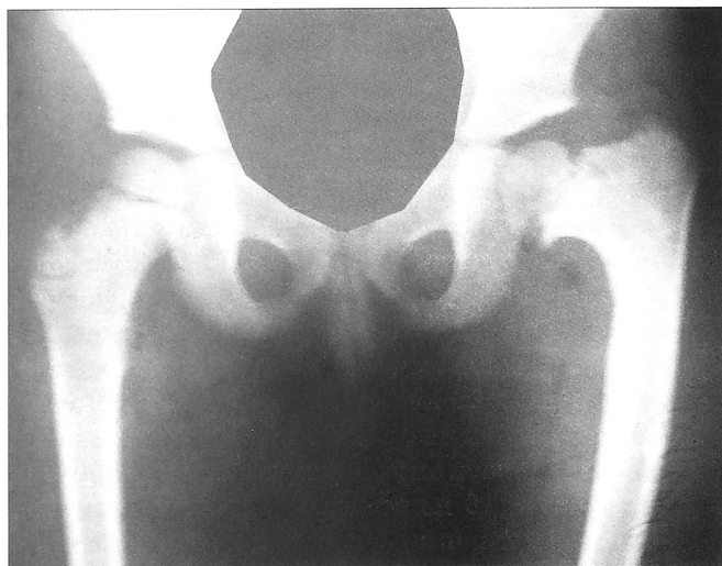
Рис. 2. Рентгенограмма тазобедренных суставов пациента с постостеомиелитической варусной деформацией шейки бедренной кости.