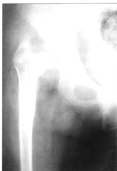
Рис. 3. Рентгенограмма больного с частичным дефектом эпифиза головки бедренной кости.