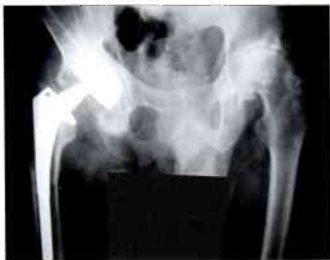
Рис. 4. Рентгенограмма больного К. 43 лет. Слева — асептический некроз головки бедренной кости IV степени. Справа — состояние через 2 года после операции эндопротезирования протезом «Феникс» первой генерации по поводу асептического некроза головки бедренной кости IV степени: зоны резорбции костной ткани вокруг вертлужного и бедренного компонентов, миграция компонентов эндопротеза.

Эндопротез «Феникс» был применен в 27 случаях. Необходимо отметить, что с этой конструкцией связано начало тотального эндопротезирования тазобедренного сустава в Рязанской области. На контрольный осмотр в срок от 2 до 11 лет после операции явились 14 больных (16 операций, в том числе одна ревизионная). Среди них было 11 женщин и 3 мужчин, средний возраст больных составлял 56,5 \pm 12 лет. У 6 больных, которым был установлен эндопротез «Феникс» первой генерации, наступила его асептическая нестабильность, что потребовало в последующем ревизионных вмешательств (рис. 4). При использовании эндопротеза второй генерации, в котором отечественный полиэтилен был заменен импортным, результат оказался неудовлетворительным у 6 из 8 осмотренных пациентов (в 75% случаев). В целом эндопротезирование тазобедренного сустава протезом «Феникс» дало неудовлетворительный результат в 85,7% случаев, в связи с чем его дальнейшее использование в нашей клинике приостановлено.