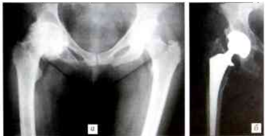
Рис. 3. Рентгенограммы больной К. 52 лет. Диагноз: двусторонний коксартроз, справа — III стадии, слева — I стадии.

Таким образом, эндопротезирование протезом «Компомед» при дегенеративно-дистрофических заболеваниях и травмах тазобедренного сустава дало положительный результат у 85% пациентов (рис. 3).