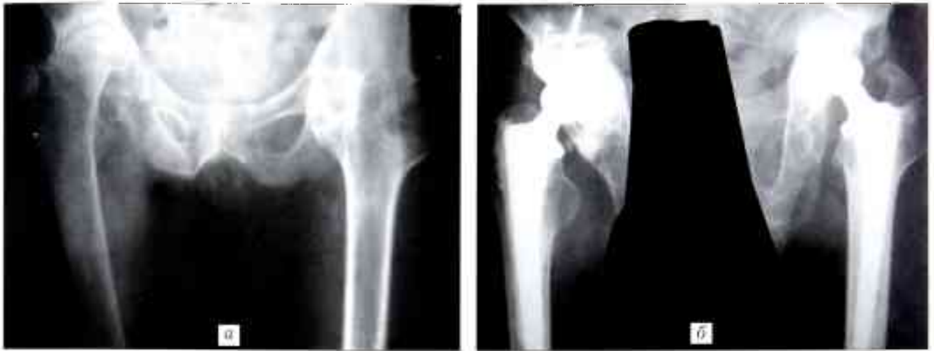
Рис. 2. Больной М. 54 лет. Диагноз: болезнь Бехтерева, костный анкилоз левого тазобедренного сустава, асептический некроз головки правой бедренной кости IV степени.

а — рентгенограмма до операции; б — рентгенограмма после эндопротезирования протезом «Иско-Рудн»: справа — через 5 лет, слева — через 8 мес после операции; в — функциональный результат лечения (оценка по Харрису для правого сустава — 90 баллов, для левого сустава — 86 баллов).