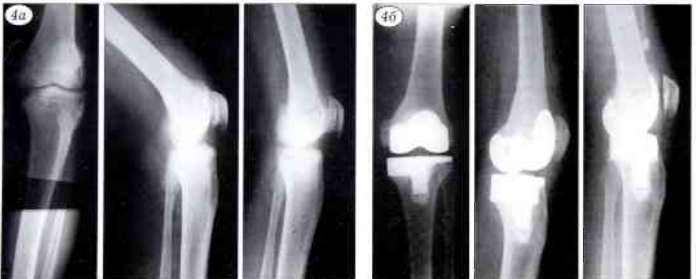
Рис. 4. Больной А. 72 лет. Асептический некроз внутреннего мыщелка левой большеберцовой кости, деформирующий артроз III стадии, варусная деформация голени (20°), бедренно-патellarный остеоартроз. а — рентгенограммы до операции; б — после эндопротезирования протезом «Zimmer» цементной фиксации. Дефект внутреннего мыщелка компенсирован дополнительным блоком.