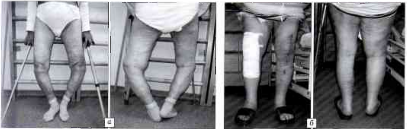
Рис. 5. Больная С. 73 лет. Двусторонний гонартроз, двусторонний асептический некроз внутренних мыщелков большеберцовой кости, варусная двусторонняя деформация (угол деформации при осевой нагрузке слева 36^\circ , справа 26^\circ ). а — при поступлении; б — произведено двустороннее эндопротезирование коленных суставов под контролем навигационного оборудования. 7-е сутки после эндопротезирования справа. Интервал между оперативными вмешательствами 2 мес.

ности эндопротеза. В нашем исследовании отклонение фронтального тибioфemorального угла было в пределах нормы (около 3^\circ ) у 88% больных. Этот показатель следует рассматривать как прогностический признак стабильности протеза с точки зрения опорности и биомеханики конечности. Фронтальный угол тибияльного компонента имел отклонение не более 3^\circ в сторону вальгуса или варуса у 91% больных. Отклонение угла бедренного компонента в допустимых пределах отмечено в 93% случаев. Эти данные свидетельствуют о том, что установка эндопротеза по осям и ротация при использовании «компьютерных» методик производится достаточно точно. Задний наклон плато большеберцовой кости при протезировании протезом Scorpio варьировал от 0 до 3^\circ (что является показателем правильной установки имплантата) у 94% больных.