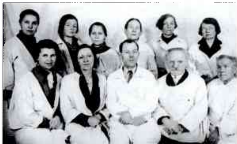
Учителя школы ЦИТО

Их надо было уметь учить. Надо было обладать неиссякаемым терпением и, главное, горячим желанием помочь каждому из