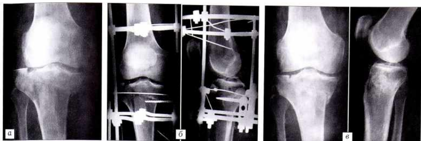
Рис. 2. Больной 3. 54 лет. Диагноз: закрытый внутрисуставной полный (Т-образный) перелом проксимального эпиметафиза правой большеберцовой кости со смещением отломков.