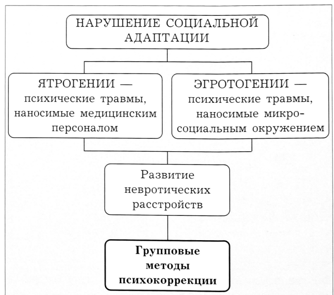
Схема 2. Отдаленный период травматической болезни.

В третий период травматической болезни (начиная с 3-го месяца) ведущим нарушением психики становится социальная дезадаптация. Развитию ее способствуют частые госпитализации и вынужденная длительная изоляция пациентов от привычного общества. У 48% мужчин и 37% женщин отмечается повышение конфликтности, агрессивности и раздражительности. Часть больных (около 34%) замыкаются в себе, отказываясь от общения, у другой части пациентов (38%), наоборот, начинают преобладать эгоистические мотивы в поведении. Многочисленные жалобы, вызовы медицинских сестер и врачей в большинстве случаев объясняются не столько тяжестью физического состояния пациентов, сколько их потребностью ощущать внимание и заботу. При этом любое пренебрежение правилами медицинской этики и деонтологии может спровоцировать у больного нервный срыв и повлечь за собой тяжелые последствия, так как именно теперь пациенты становятся наиболее чувствительными к замечаниям, сделанным по поводу состояния их здоровья, хода лечения, к словам, брошенным вскользь медицинским персоналом [5]. На данном этапе в фокусе работы медицинского психолога оказывается профилактика ятро- и эгротогений — психических травм, наносимых медицинским персоналом и микросоциальным окружением больных в отделении (схема 2).