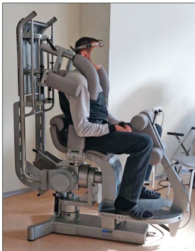
Рис. 1. Положение пациента X. в аппарате.