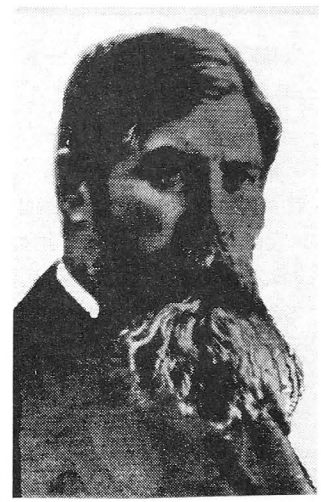
Рис.2. Первый главный редактор журнала "Неврологический вестник", проф. В.М.Бехтерев

Направление и структура журнала не изменялись в течение всего периода его существования. Печатались работы, посвященные невропатологии с судебно-психиатрической казуистикой,