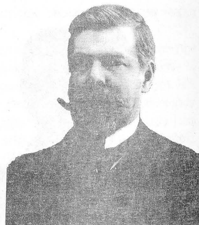
Рис. 5. Соредактор журнала "Неврологический вестник" проф. В.П.Осипов

В.П.Осипова в Казани стала публикация в «Неврологическом вестнике» статьи «К этиологии кататонии» 12 , в которой была дана принципиально новая патофизиологическая трактовка кататонических проявлений. Избрание В.П.Осипова профессором Военно-медицинской академии в Петербурге не помешало ему продолжать редактировать «Неврологический вестник» в качестве иномгородного редактора.