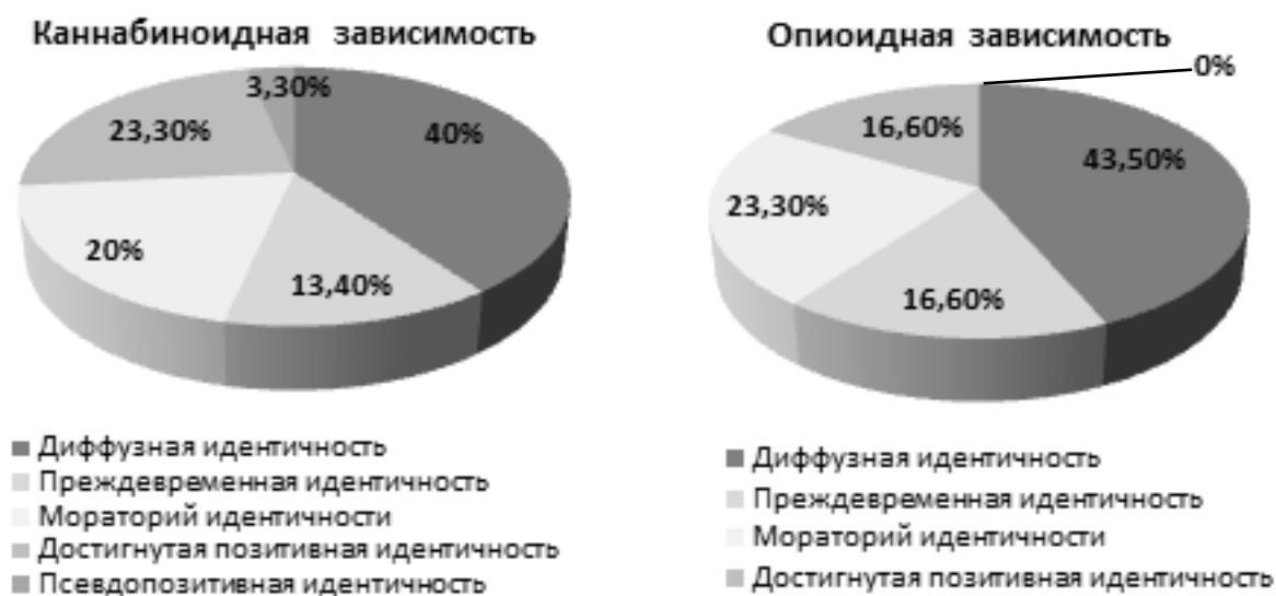
Рис. 2. Статусная система личностной идентичности при наркотической зависимости.