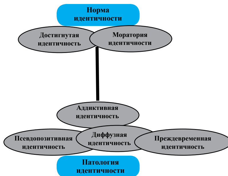
Рис. 1. Распределение статусной системы идентичности в континууме «позитивная идентичность – негативная идентичность».

тальное свойство психики, лежащее в основе многих феноменов при нормальном и нарушенном функционировании психики. Вариативность и распространенность форм диссоциативных состояний указывают на важность их значения в функционировании психики с точки зрения адаптации к меняющимся условиям природной и социальной среды. Феномен диссоциации впервые был описан П. Жане в рамках концепции диссоциации. Психологическое содержание феномена диссоциации определяется как характеристика процесса, посредством которого согласованный набор действий, мыслей, отношений или эмоций становится отделенным как структурный элемент личности и функционирует независимо [22].