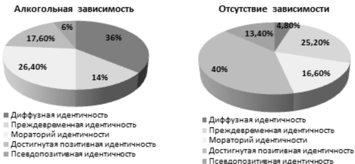
Рис. 3. Статусная система личностной идентичности при отсутствии наркотической зависимости.

самооценкой, приводящей к сомнениям в своей способности что-то изменить или предпринять (рис. 2).