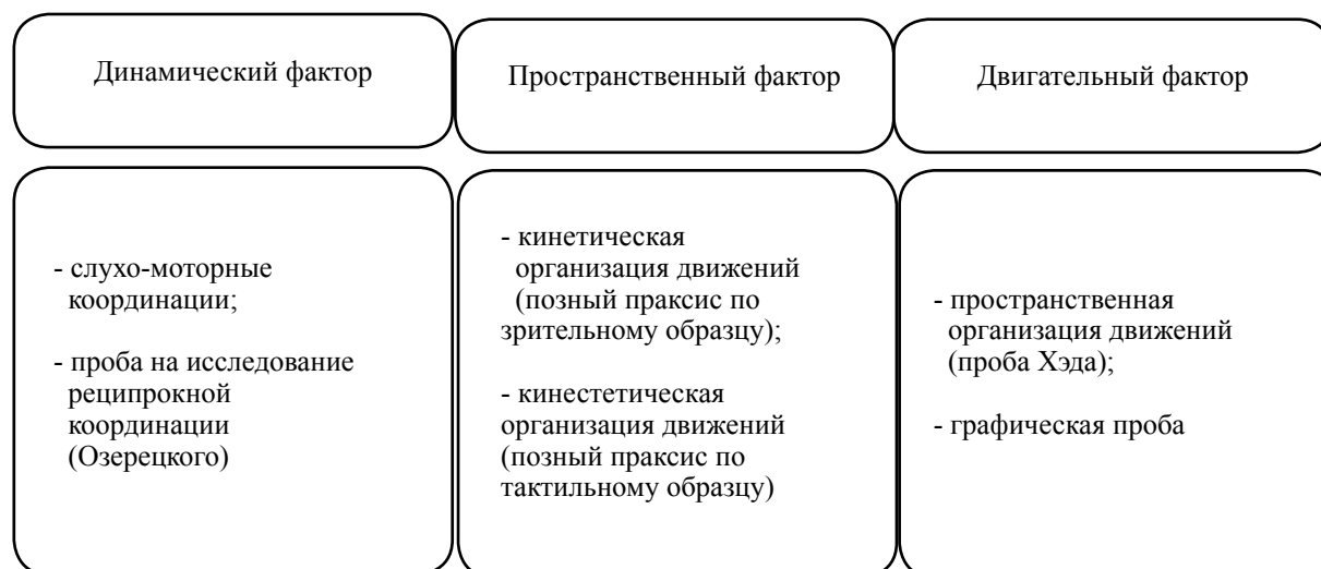
Рис. 2. Факторная структура реципрокной организации у здоровых подростков.

и кинестетической организации движений (по тактильному образцу) ( F=0,634 ).