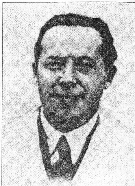
Профессор Х.И.Гаркави (1897—1958)

болезней был избран проф. Хаим Иосифович Гаркави (1897—1958). Являясь неврологом-нейрохирургом, он организовал нейрохирургическое отделение, патогистологическую лабораторию. Научной тематикой клиники в этот период были вопросы нейроонкологии и нейротравматологии. В годы Великой Отечественной войны на базе клиники был создан крупный нейрохирургический госпиталь для раненых с черепно-мозговыми травмами.