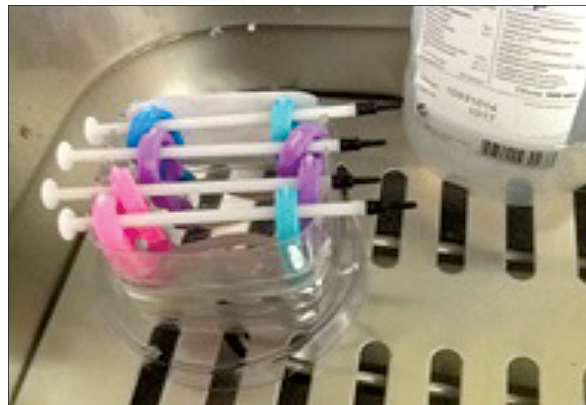
Система «вывернутого» изолированного отрезка тонкой кишки крысы.