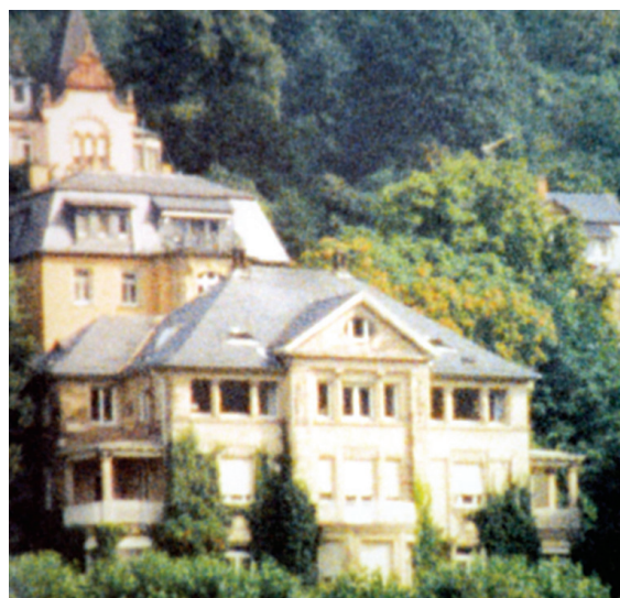
Рис. 2. Вилла Черни.