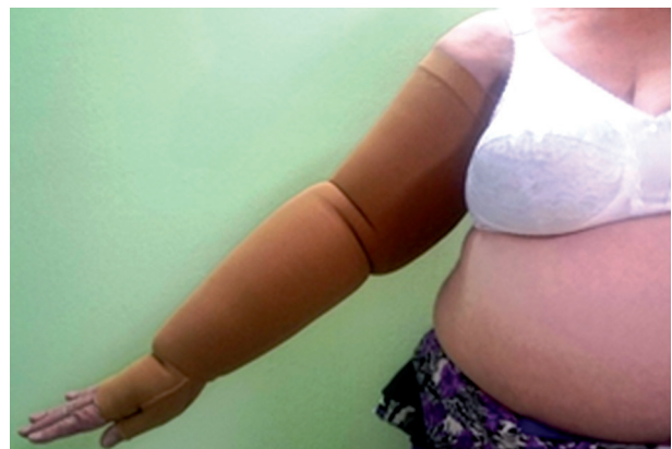
Рис. 3. Пациентка Ф., 62 года.