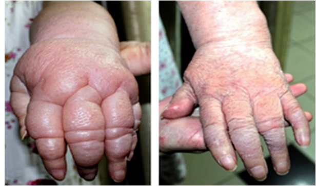
Рис. 1. Пациентка Л., 82 года.