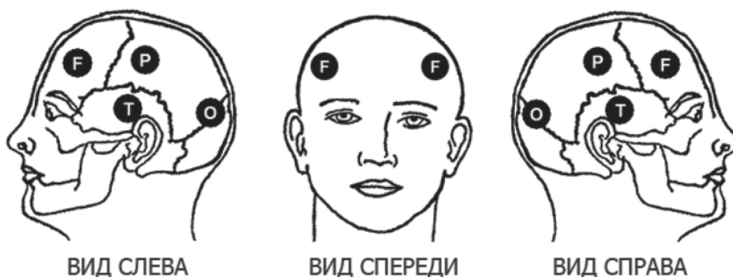
Рис. 2. Схема расположения диагностических точек для ИСГ

формированием внутричерепных гематом в данной группе отсутствовали, повторные операции по поводу внутричерепных гематом не проводились.