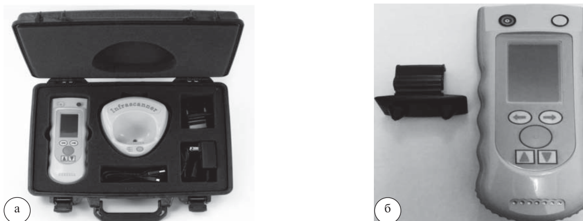
Рис. 1. Общий вид переносного контейнера с компонентами системы «IM2000S» (а) и общий вид аппарата с одноразовым светодиодом (б)