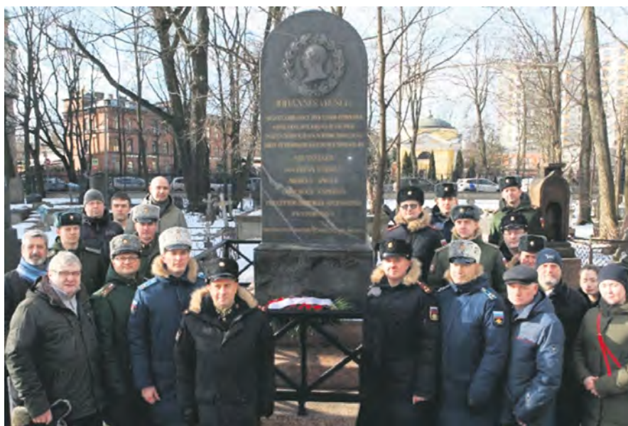
Рис. 3. Возложение цветов к могиле И.Ф. Буша в день его 250-летия. 3 марта 2021 г, Смоленское лютеранское кладбище, Санкт-Петербург

Школа, созданная И.Ф. Бушем, являлась русской школой, отличной от западных хирургических школ в своей основе, по стилю и организации преподавания. Она выдвинула плеяду крупных ученых-хирургов, прославивших отечественную науку. Представители этой школы сделали важные исследования в области хирургии, анатомии,