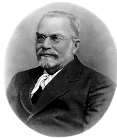
Рис. 1. Профессор И.П. Скворцов (1916) Fig. 1. Professor I.P. Skvortsov (1916)

В предисловии (рис. 3) автор указывает, что «в основе книги лежат шесть лекций по военно-полевой гигиене, которые он прочитал в 1877 г. в Казанском офицерском военном собрании». Далее он как будто извиняется перед читателями, что «не являясь военным врачом счел возможным на основе изучения русских литературных источников», например Военного сборника, обратить внимание, прежде всего, на «возможность общего теоретического понимания успешности профилактических мероприятий» среди военнослужащих, особенно в военный период. Далее он указывает на то, что «ему не известно ни одного систематического руководства по избранному предмету».