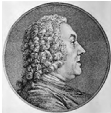
Ил. 1. Граф де Келюс (из кн.: Pons 1914)

фе дали такую оценку его трудам: «Все виды искусства — братья. М. де Келюс, казалось, был в этом убежден, потому что он их развивал или по меньшей мере страстно любил. Он написал о жизни наиболее выдающихся художников королевской Академии живописи и скульптуры, членом которой и являлся в качестве почетного любителя» 15 (Ил. 1).