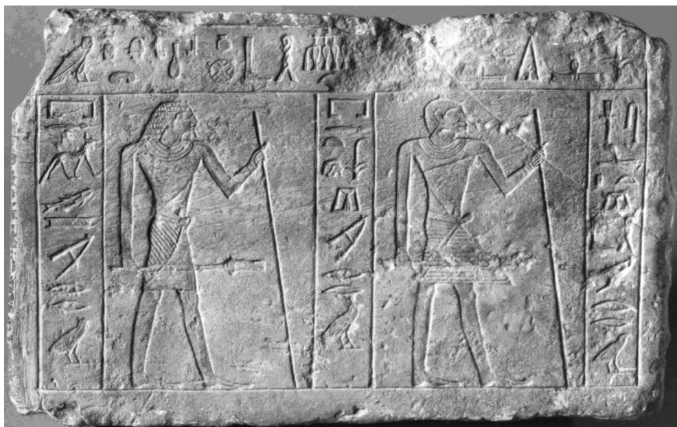
Ил. 2. Фрагмент архитрава Эрмитаж 2953

Судя по композиции верхней фразы, перед нами левая часть архитрава вельможи Мереру ( mrrw ). Ее правая часть хранится в Эрмитаже (Bolshakov 2005: 168–173, pl. 33) 2 . На нее нанесены следующие надписи: