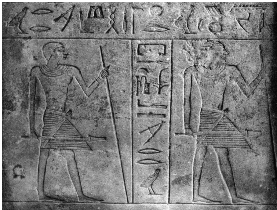
Ил. 1. Фрагмент архитрава из каталога Яманака

На архитраве сохранилось два текста: левая часть длинной горизонтальной надписи и вертикальная надпись с титулом и именем владельца, помещенная между двух идущих фигур сановника.