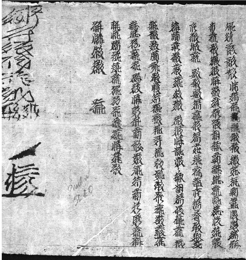
Ил. 2. ИВР РАН. Тангутский фонд (Шифр Танг 1770). Фрагмент 2