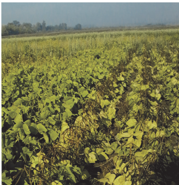
Рис. 1. Созревание маша 2018 г.

среды. Особое внимание уделяли устойчивости к недостатку влаги в сочетании с высокой температурой воздуха. За все годы наблюдений период вегетации растений маша сопровождался недостаточной влагообеспеченностью, ГТК периода вегетации 2013 – 2016, годов был равен или ниже 0,7. Математическая обработка результатов выполнялась с использованием пакета прикладных программ в Microsoft Excel 3.