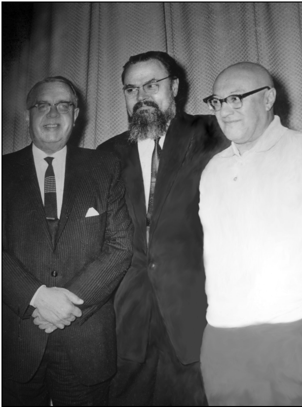
На фотографии слева направо: выдающийся пианист Л. Оборин, народный художник СССР А.И. Лактионов, профессор А.А. Вишневский