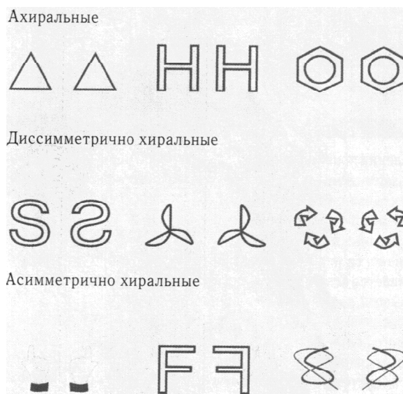
Рис. 1. Примеры зеркальной изомерии (хиральности) химических структур веществ

Более детальное изучение препаратов, получаемых синтетическим путем, показало, что в большинстве случаев продуктами синтеза являются рацемические смеси изомеров, имеющих разную пространственную конфигурацию и разное число плоскостей симметрии. Молекулы и соединения, структуры которых проявляют зеркальную изомерию, химики называют хиральными (от греч. Cheir — рука) (рис. 1).