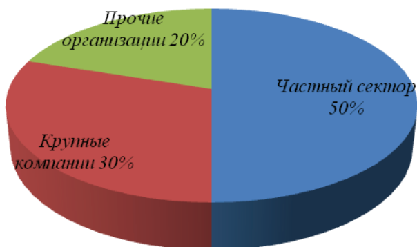
Рисунок 2. Структура рынка потребления услуг легкового автотранспорта

По данным Мосгорстата, в структуре потребителей легковых автоперевозок (услуг такси) преобладают физические лица. На их долю приходится 50% грузо перевозок. Доля крупных компаний составляет 30%, на прочие приходится – 20% от общего объема перевозок. Эти данные представлены на рисунке 2.