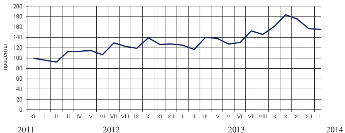
Рисунок 1. Коммерческий грузооборот организаций автомобильного транспорта 2012-2013 гг. в % к 2011 г.

По данным Мосгорстата, коммерческий грузооборот в г. Москве также имеет тенденцию к снижению. Объем перевозок грузов крупными и средними организациями автотранспорта в январе 2014 г. составил 0,9 млн тонн, грузооборот – 264,5 млн т-км.