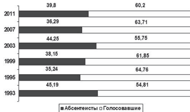
Рисунок 2. Участие россиян в выборах Государственной Думы Федерального собрания РФ (% от внесенных в списки для голосования) [8, с.127]

Получить представление о явке на парламентские выборы в России позволяют данные Центральной Избирательной комиссии РФ (рисунок 2).