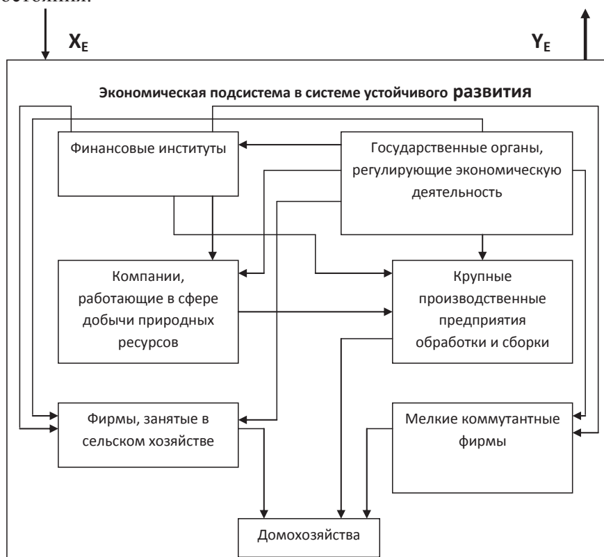
Рисунок 2. Элементы структуры экономической подсистемы, выделенные по критерию иерархии зависимости реализации интересов

При выделении экономической подсистемы в системе устойчивого развития, используя описанный принцип и учитывая, что модель должна в дальнейшем описывать рациональное производство и потребление, в части государственной компетенции выделяют приходную и расходную части бюджета, макроэкономические финансовые инструменты и регуляторы, капиталовложения, а также справедливый обмен в товарных отношениях. Количество описываемых элементов при этом необходимо минимизировать. Такая структура представлена на рисунке 2, в которой стрелками показаны внутренние связи приоритетного подчинения или, другими словами, показано направление управления. В данном случае управлением будем считать не только прямое (формализованное) воздействие, но и создание целевых условий, под влиянием которых объект управления сам выбирает требуемое направление изменений своего состояния.