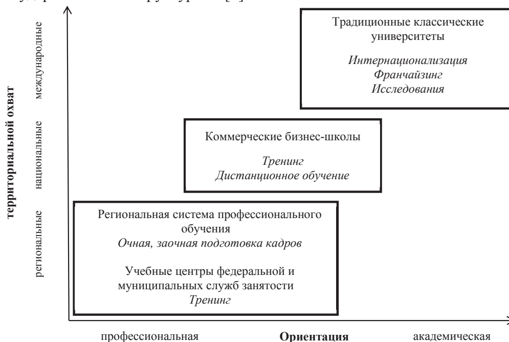
Рисунок 3. Стратегические группы реализации программ подготовки кадров для малого и среднего бизнеса [3]

Указанные факторы формируют необходимость создания специальных программ, учитывающих изменение социальной составляющей малых и средних предприятий. Эти программы могут развиваться как бизнес-школами (университетскими или частными), так и различными государственными структурами [3].