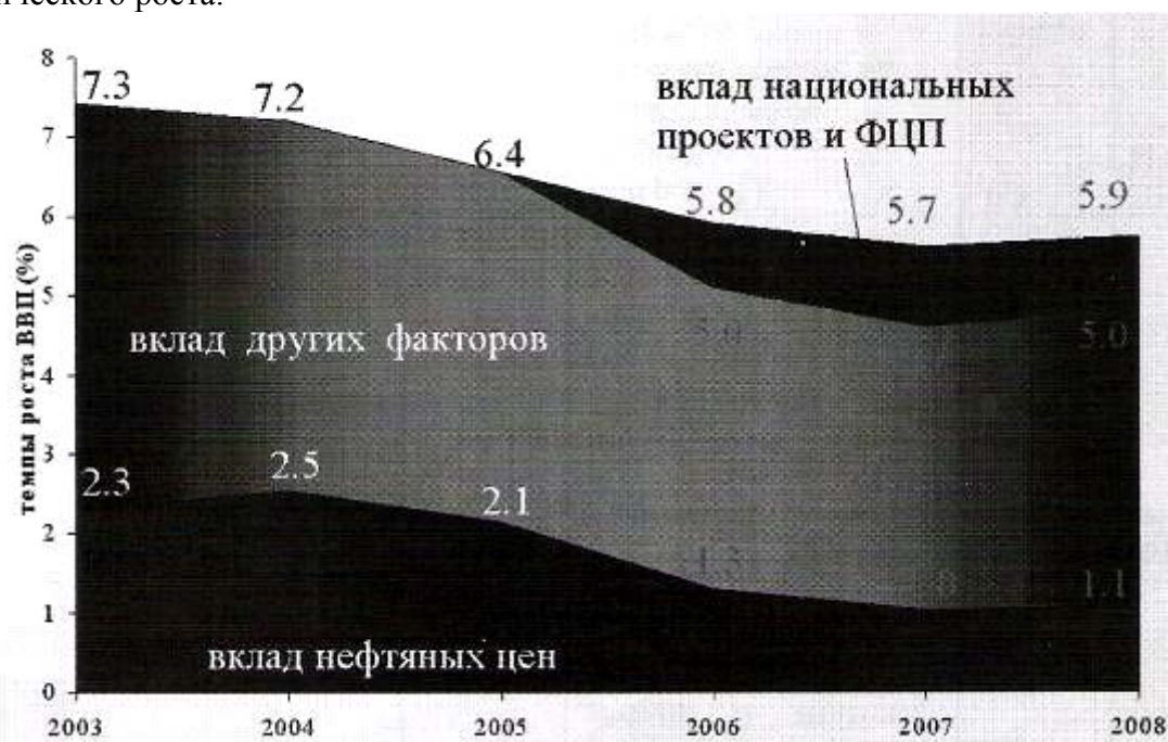
Рис. 1. Динамика ВВП и вклад факторов в рост экономики.

Программа социально-экономического развития РФ (2006-2008 г.г.) содержит приоритетные национальные проекты, пакет антиинфляционных мер, предложения, связанные с развитием топливно-энергетического сектора, меры по обеспечению дополнительных темпов экономического роста.