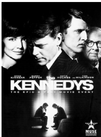
Особое место в списке американских политических фильмов-биографий принадлежит кинопортретам представительниц семейства Кеннеди («Клан Кеннеди» (2011))

том постоянного интереса и изучения со стороны национального кинематографа. Для кинематографа США особый интерес представляет 16-й президент А. Линкольн, чаще других становившийся героем политического байопика.