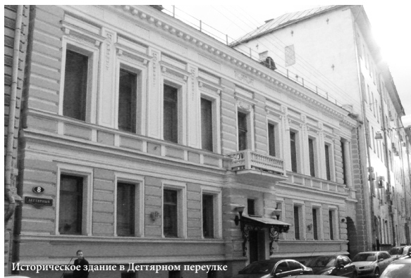
Историческое здание в Дегтярном переулке

писал Бродский. Вроде бы странно: разве сорок — это много? Но жизнь измеряется не годами, а делами и событиями. И с точки зрения того, что было за эти годы создано Институтом, располагавшим собственным издательством и прочными связями с престижным издательством «Искусство», — да, она длинная. Очень.