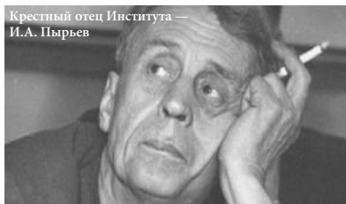
Крестный отец Института — И.А. Пырьев

Пырьев не дождал до осуществления этого плана. Но идея опять не пропала; таилась в долгих ящиках начальственных кабинетов в ожидании удобного случая, и вот он подвернулся в виде Постановления ЦК КПСС «О мерах по дальнейшему развитию советской кинематографии». В качестве