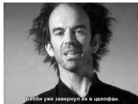
Бабби уже завернул их в целлофан.

В основе фильма полуфантастическая история о 40-летнем недоумке Бабби (великолепно сыгранным актером Н. Хоупом), который за всю свою жизнь не видел ничего, кроме обшарпанных стен окраинного полуподвала. Единственное, что он умеет, — подражать другим. Страсть к подражанию оказывается роковой. Осиротев, герой отправляется на поиски правды, переживая головокружительную одиссею идиота в мире зла и насилия. Но самое страшное, что благодаря привычке подражать другим, Бабби везде оказывается своим, без всяких проблем общаясь с «нормальным» миром. Границы между нормой и патологией перестают существовать. Рассказывая историю «простодушного», Де Хир рисует картину наступающего конца света. Его герой Бабби, побывав во всех возможных и невозможных ситуациях, опровергает и смешивает привычные нормы, начиная с инцеста и кончая убийством. Фильм откровенно шокировал... но и заставлял размышлять.