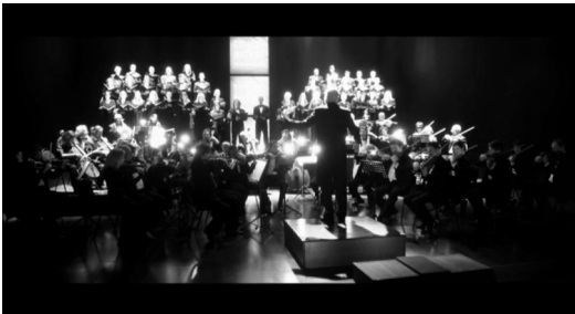
Кадр из фильма «Дирижер»

Библейское писание о прощении обретает в фильме П. Лунгина глубокий смысл, что достигается точным и образным решением. Фильм цветной, но доминирующие цвета в нем бело-желтый и черный. Свет и тьма. Добродетель и порок. Противостояние. Авторы картины выдерживают изобразительный ряд в строгом контрасте, и это великолепно отражает колорит природы Израиля: выжженный солнцем песок, сухое дерево, стволы пальм. На этом фоне — темные пятна одежды персонажей. Сцена, кулисы,