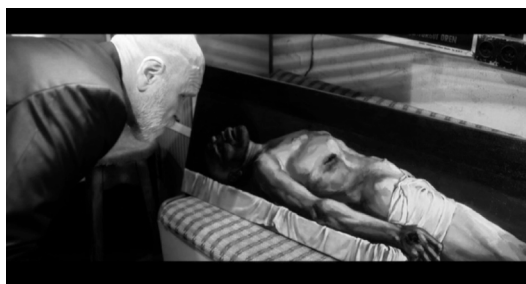
Кадр из фильма «Дирижер»

Контрастно решается и облик главного персонажа: белая (седая) борода и черный халат, черный пиджак. Образ Дирижера (В. Багдонас) начинает проясняться с первой сцены, когда он спит на широкой кровати в своей квартире с черным роялем. Лицо, погруженное в темноту, проработано до тончайших деталей — голова запрокинута, торчит ершик бороды, спящий накрыт красноватой тканью. Именно таким, беспомощно спящим с запроки-