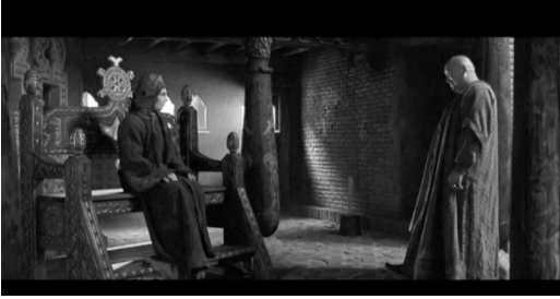
Кадр из фильма «Орда»

Изобразительное решение ленты основано на объемных декорациях с большим количеством придуманных бытовых подробностей (улицы стана с установленными орудиями казни, ханский шатер и т. д.). Художники и оператор картины последовательно в задуманном цвето-