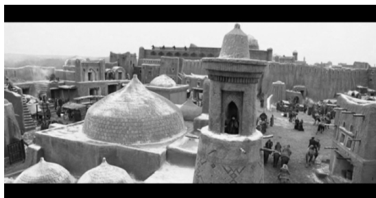
Кадр из фильма «Орда»

ников трансформируется в фильме в огромный стан. Возможно, авторы отталкивались от новой версии, выдвинутой на основе археологических раскопок. В любом случае, зрителю представлен весьма необычный для отечественного кино жанр «фэнтэзи» на историческую тему.