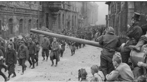
Кадры из фильма «Белый тигр»

Фильмы, представленные на национальную премию «Золотой Орел» в 2013 году, выявили новые тенденции развития отечественного кинематографа. Так, картина «Белый тигр» К. Шахназарова продемонстрировала неординарный философско-притчевый взгляд на тему Великой Отечественной войны, а фильм «Орда» А. Прошкина показал, что исторический материал может стать основой для