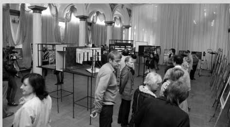
Встреча первых посетителей