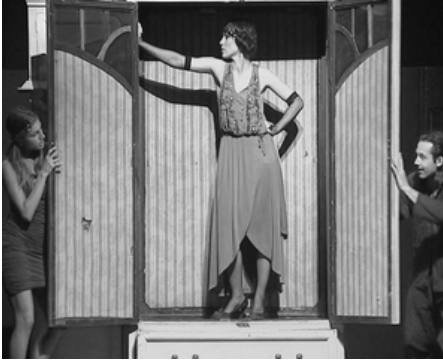
Сцена из спектакля "Зойкина квартира" в исполнении ВГИКовских студентов

актером, лаконизмом. Тогда как для работ студентов-художников ВГИКа важны детали, проработка персонажей, точные подробности. Ведь кино, в отличие от театра, использует крупные планы. Кроме того, разная степень условности экранного и сценического пространства значительно влияет на работу художников. Если в театре художник подчас обязан создавать гротескную, гиперболизированную среду, и декорация служит ярким образом, символом, то в игровом кино у художника меньше выразительных средств, он скован реалистичностью кинопространства. Но тем ценнее его умение создавать яркий художественный образ среды фильма. Другое дело — анимация, где образные возможности, степень пластической свободы в мультфильме значительно ближе к театральной условности.