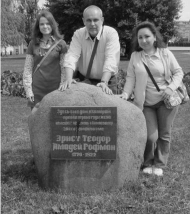
Заветный камень на месте родного дома Гофмана обнаружен