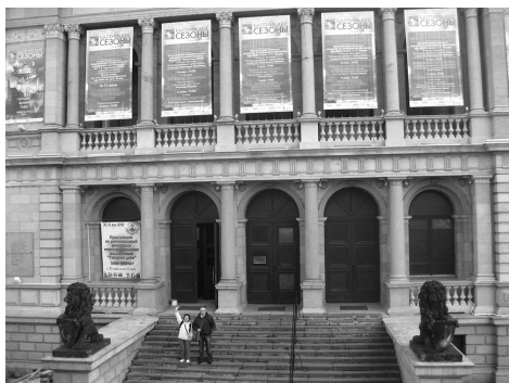
Дворец творчества молодежи в Калининграде разместились в здании бывшей кёнигсбергской биржи.

Выставка проходила во Дворце творчества молодежи (бывшая кёнигсбергская биржа), здании грандиозном, напоминающем дворец дождей в Венеции, стоящий на берегу канала в самом центре города. Местные жители утверждают, что в нем несколько подводных этажей, где во время войны изготавливали снаряды, и с канала туда заплывали подводные лодки. Выставку нужно было разместить в большом нарядном фойе это-