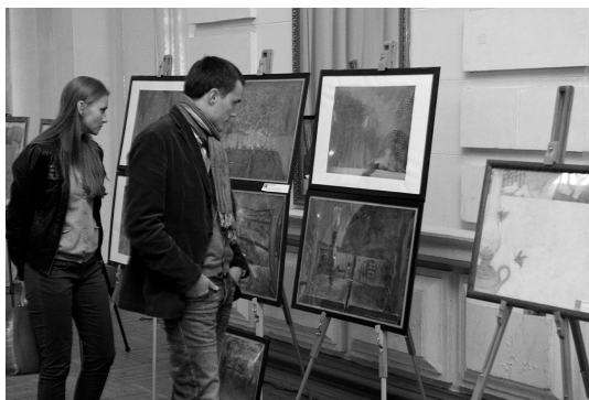
Посетители выставки с интересом изучают работы

В итоге пестрая компания эскизов удачно «пришвартовалась» вдоль стен фойе, а театральные макеты образовали островок посередине зала.