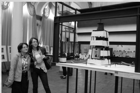
Первое впечатление от работ