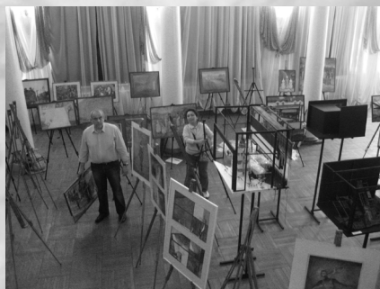
Рождение концепции выставки