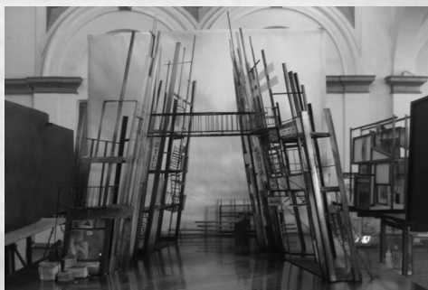
Предварительный этап экспозиции