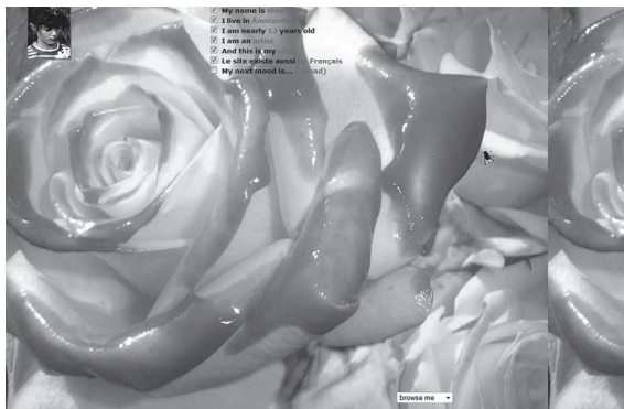
Вид главной страницы проекта «Mouchette.org»

Попадая на первую страницу «Mouchette.org», зритель видит красочное изображение розы, по которой бегают анимированные мушки. В верхнем левом