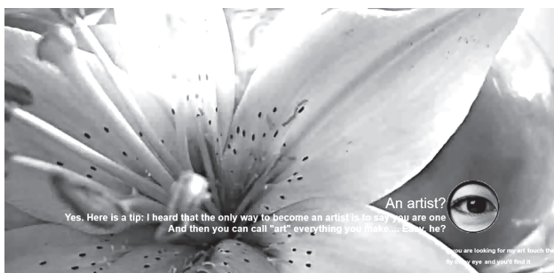
Фрагмент страницы «Мушка в глазу»

Часто визуальный ряд не соответствует текстам, либо тексты при их сопоставлении указывают на двойной смысл. Автор последовательно заставляет зрителя искать подтекст. Двойное дно есть во всем, даже в том, что